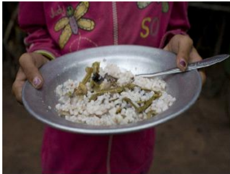
The daily meal for a child – Anthev Koma, Cambodia.